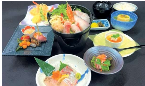
賢島 スタンダードコース (2食付き) 一例

お1人様 和室 兼泊り 2名以上1室 補助適用後 6,290円 ～ 通常期 平日・休日