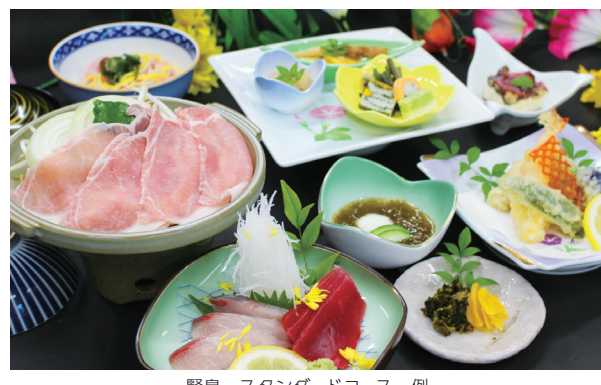
賢島 スタンダードコース一例